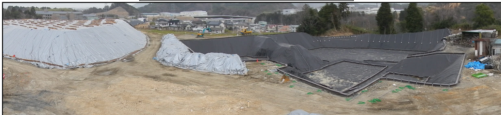
写真① A区画キャッピング