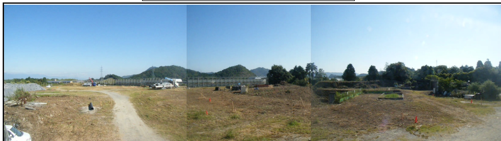
写真③ 浸透水揚水井戸 No.1・No.2