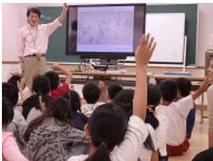
美術館所蔵の鳥獣人物戯画のお話

アニメのルーツと言われている国宝の「鳥獣人物戯画」についてお話を聞き、巻物のレプリカ(約 12m)を広げて鑑賞、そして巻物から自由に絵を選び、水墨を使って模写体験をします。 国語科の授業「解説文を読み解く」をテーマに実施する学校も増えています。