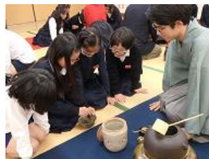
おもてなしの会に向けた準備