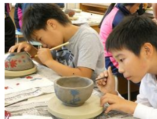
絵付けは一回勝負！