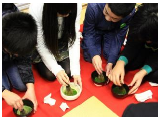
お茶を点てる体験