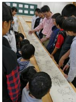
巻物を対話式で鑑賞