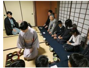
茶道家によるお茶会体験