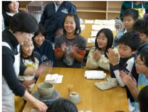
陶芸家による制作の説明