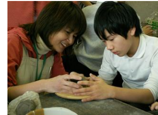
コーディネーターが授業を調整 学生文化ボランティアも参加