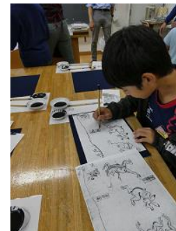
濃墨・薄墨を使い分けて模写体験