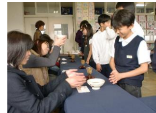
おうちの方に感謝の気持ちを 伝えるおもてなしの会