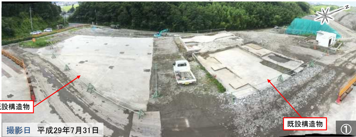
撮影日 平成29年7月31日