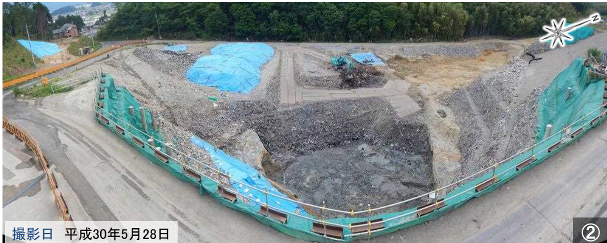
撮影日 平成30年5月28日