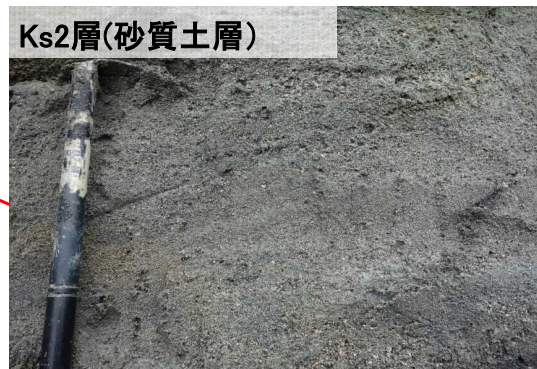
Ks2層(砂質土層) 砂分を主体とし Kc3層と比較して固結度は低い