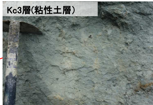
Kc3層(粘性土層) 細粒で固結度が高く 割れ目等は認められない