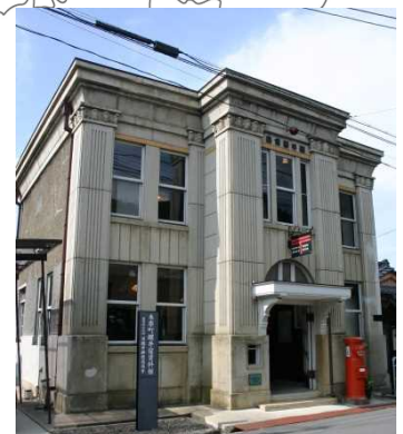
↑写真は左からアンドリュース記念館、豊郷小学校旧校舎群、醒井宿資料館