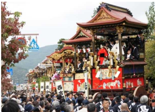
↑大津祭【国指定重要無形民俗文化財】