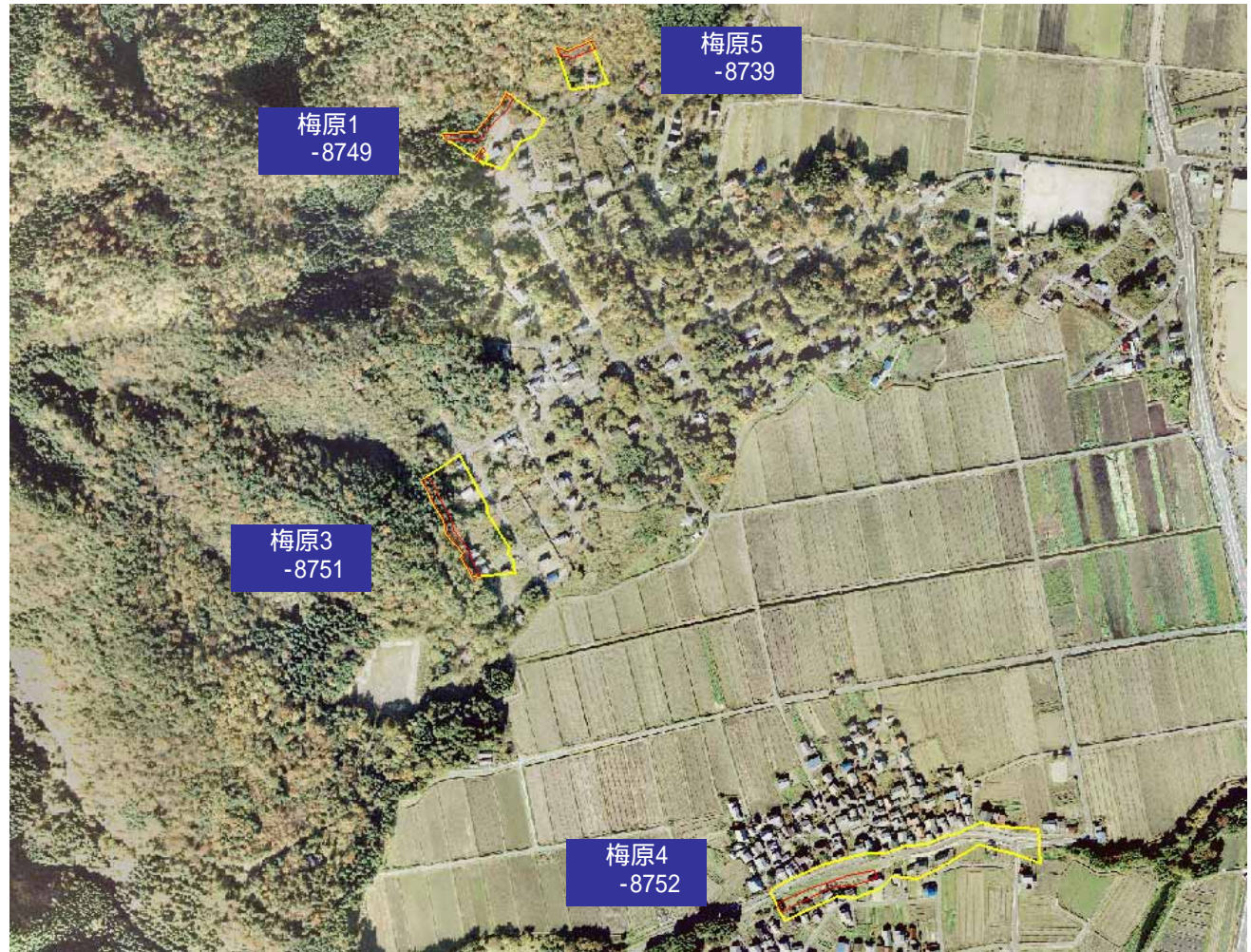
土砂災害警戒区域図

・この地図は、国土地理院長の承認を得て、同院発行の数値地図25000(地図画像)を複製したものである。(承認番号 平16総複、第205号)