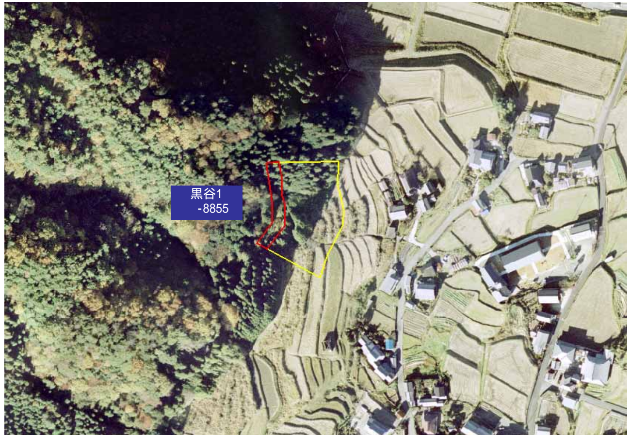
土砂災害警戒区域図

・この地図は、国土地理院長の承認を得て、同院発行の数値地図25000(地図画像)を複製したものである。(承認番号 平16総複、第205号)