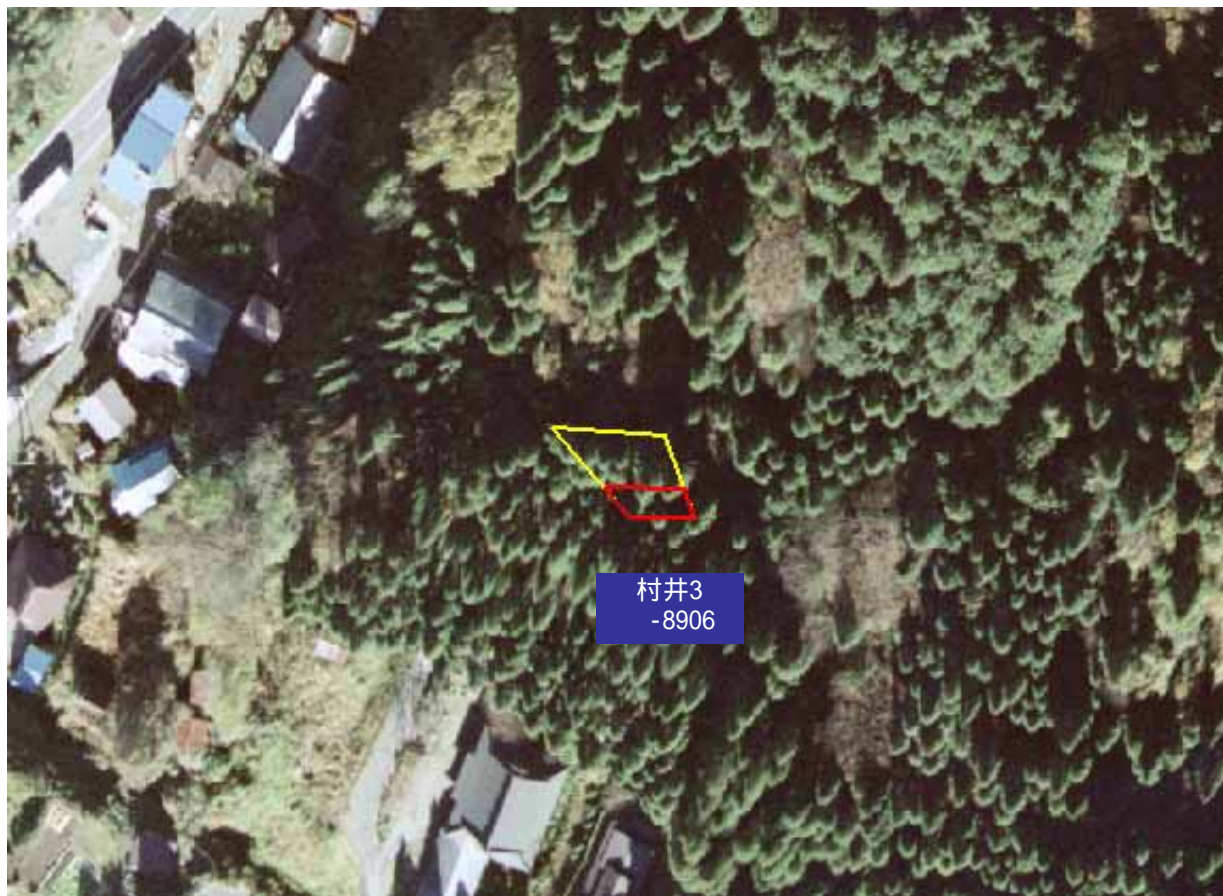
土砂災害警戒区域図

・この地図は、国土地理院長の承認を得て、同院発行の数値地図25000(地図画像)を複製したものである。(承認番号 平16総複、第205号)