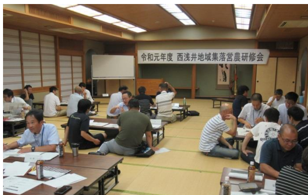
集落ごとでのグループワーク

次回、連続講座の第3回目で、現在の組織・地域農業を担うリーダーや役員の方々に、各自の集落の将来の担い手タイプを明確にするとともに、その確保に向けた改題解決の方策について引き続き検討いただきます。