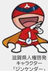
滋賀県人権啓発キャラクター「ジンケンダー」