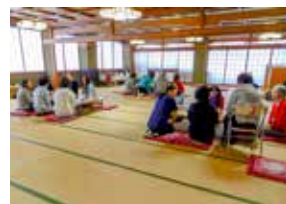
第1回交流カフェの様子

センターでは、県内在住のひとり親家庭の親を対象に、同じ立場の方同士で悩みを打ち明けたり、情報交換したりする場として、「交流カフェ」を開催しています。健康や家計などの暮らしに役立つ講演と、お茶を飲みながら交流する時間もあります。お子さんの託児もあります(要予約)。気軽にご参加ください。