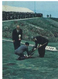
天皇陛下お手植え (ヒノキ)