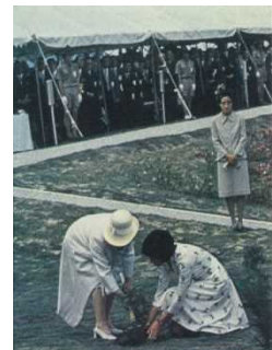
皇后陛下お手植え (モミジ)