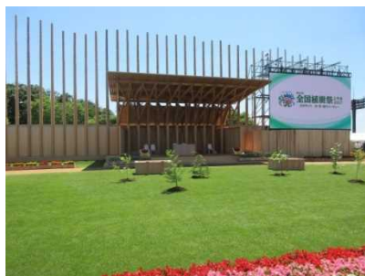
県産材を活用したお野立所 (第68回全国植樹祭〔富山県〕)