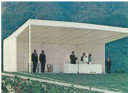
天皇陛下のおことば