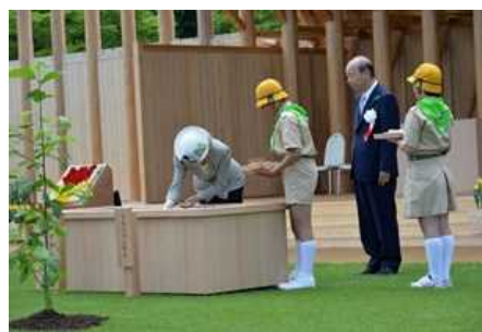
皇后陛下お手播き (第68回全国植樹祭〔富山県〕)