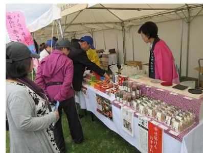
おもてなし広場での物産販売等 (第 68 回全国植樹祭〔富山県〕)