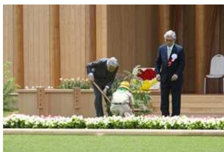
天皇陛下お手植え (第68回全国植樹祭〔富山県〕)