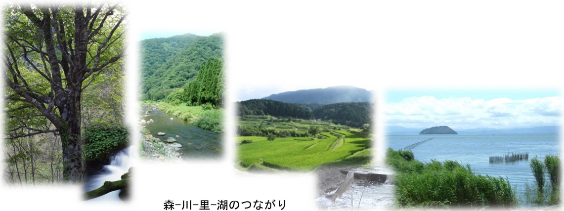
森-川-里-湖のつながり

森林と私たちの暮らしのかかわりを振り返ると、 古代より、奈良や京都そして滋賀の壮麗な宮殿・社寺の建設には、滋賀の木材が多く利用されてきました。また、中世・近世・近代にかけて、人々は貴重な森林資源を巡り、争い、話し合い、力を合わせるというドラマを展開してきました。一方、県内には山村地域を中心に多種多様な森林文化が根付いています。木を植え、育て、伐って利用し、また植えるという先人たちの取組は、まさに持続可能な森林づくりの礎であり、現在に暮らす私たちもしっかりと次の世代に受け継いでいく必要があります。また、「せっけん運動 ※1 」をはじめ、湖岸の清掃やヨシ刈りなど琵琶湖の環境保全に熱心に取り組む姿勢や、琵琶湖の下流域で水を利用する人々を気遣う思いやりの精神は、滋賀の県民性として私たちの暮らしの中に定着しています。