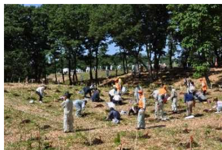
植樹会場 (第68回全国植樹祭〔富山県〕)