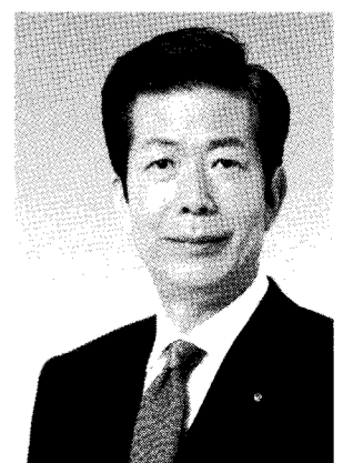
公明党代表 山口那津男