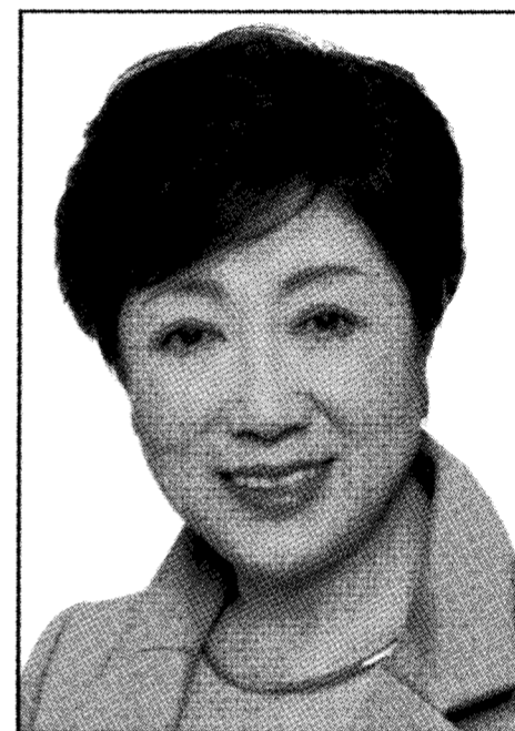
希望の党 代表 こいけ ゆりこ 小池 百合子