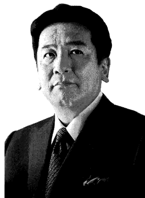
立憲民主党 代表 枝野幸男

国民のみなさんの日常の暮らし、 現場のリアルな声に根ざした、 ボトムアップの政治を実現する。それが私たちの描く、 日本の未来です。右でも左でもなく、前へ。