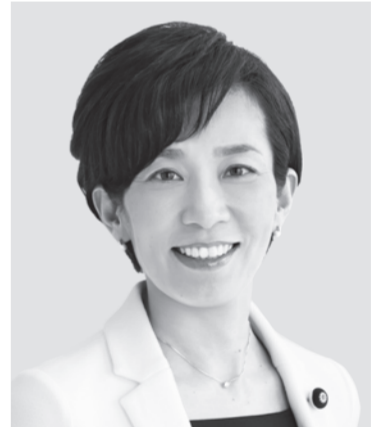
やまもと 山本 かなえ 現

役職:元厚生労働副大臣。 参院議員3期。 経歴:京都大学文学部卒。 年齢:48歳