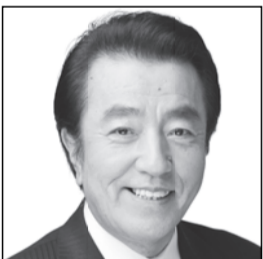
日本維新の会参議院幹事長 元国土交通大臣政務官 むろい 邦彦 子や孫たちに夢をつなぐ国づくり