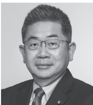
党書記局長 小池 晃 現 59歳。参院議員3期。全国革新懇代表世話人。医師。 活動地域 東京