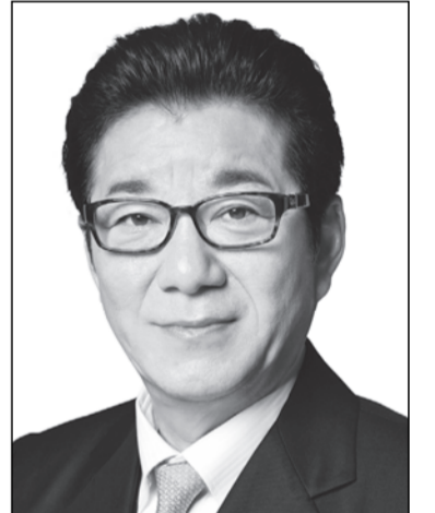
代表 松井 一郎