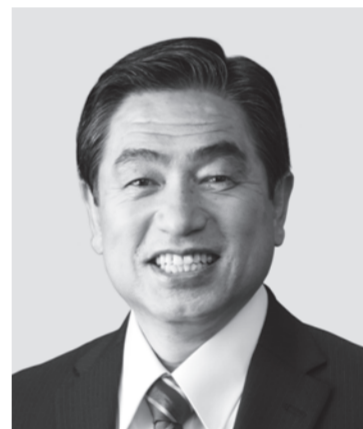
わかまつ 若松 かねしげ 現

役職:元復興副大臣。参院議員1期。 経歴:中央大学二部卒。公認会計士。 税理士。行政書士。 年齢:63歳