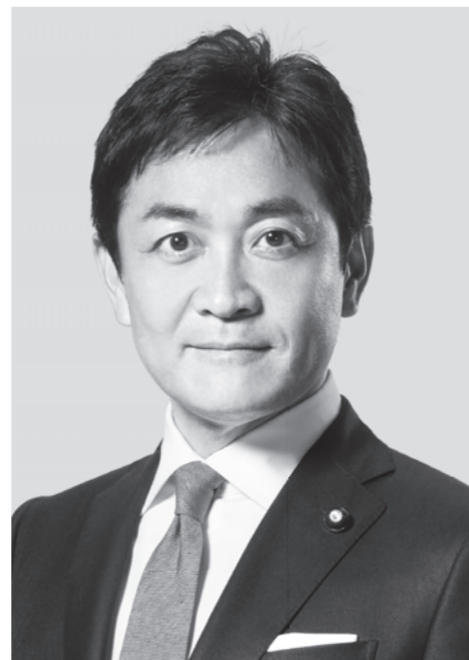
国民民主党 代表 玉木雄一郎