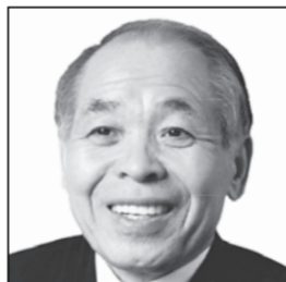
元衆議院議員/元国務大臣 北海道・沖縄開発庁長官 鈴木 宗男 政治に喝! 北方領土問題解決