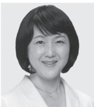
前衆院議員 梅村 さえこ 新 55歳。元消費税をなくす全国の会事務局長。 活動地域 埼玉、茨城、栃木、群馬