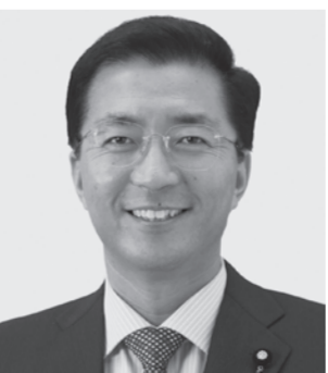
党副委員長 山下 よしき 現 59歳。参院議員3期。 活動地域 大阪、兵庫、滋賀、奈良、和歌山