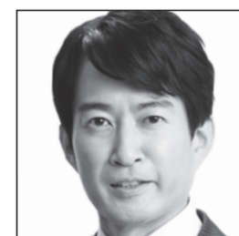
早稲田大学卒/東京都議会議員(3期) 東京で維新を、プリーズ!7年間 やながせ 裕文 子どもたちの未来へ!