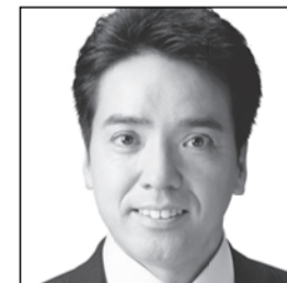
東京大学大学院修了(工学博士) 衆議院議員(1期) 空本 せいぎ 政治家として、技術者として、誠実な実績