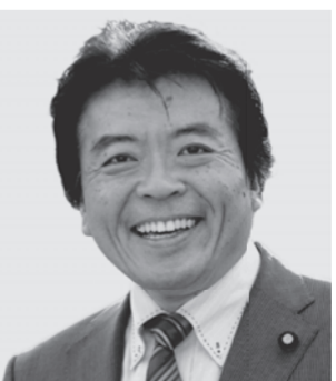
弁護士 仁比 そうへい 現 55歳。参院議員2期。党参院国対副委員長。 活動地域 中国、四国、九州・沖縄