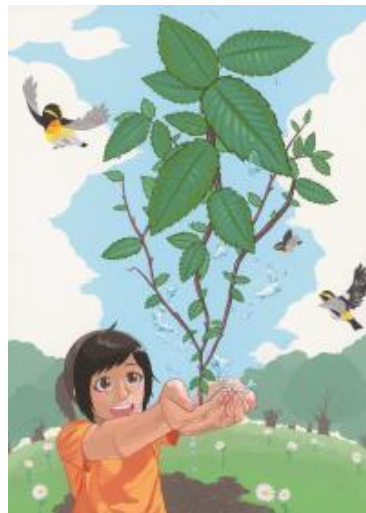
平成30年度 福島県大会