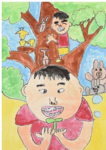
令和元年度 愛知県大会