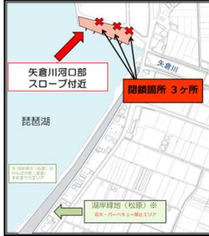
湖岸緑地松原～矢倉川河口部スロープ付近一帯地図

告知 湖岸緑地松原・矢倉川河口部スロープ付近一帯の利用者のみなさまへ 近隣住民や他の利用者の危険・迷惑となる行為（早朝からの騒音、バーベキュー、ゴミの放置、路上駐車等）が多発していることから、来る 8月2日～9月30日 までの期間、試験的に左記の場所への車両乗り入れができませんよう、入口を閉鎖します。 彦根市 観光企画課 松原町自治会 滋賀県 琵琶湖政策課・都市計画課 彦根市 環境政策課・湖東土木事務所 高根区役所 松原町自治会