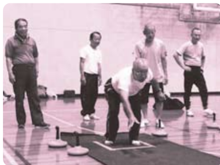
▲(ニュースポーツ)ユニカール