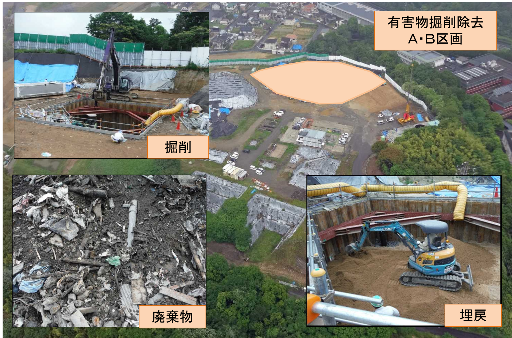
有害物掘削除去 A・B区画