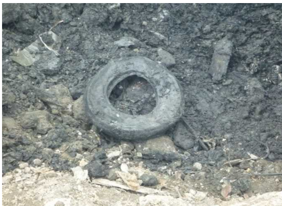
廃プラスチック類