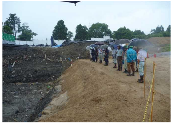
7月3日(木) A-3区画・B区画見学状況