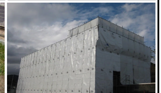
当該建物の周囲を その高さまで囲います。