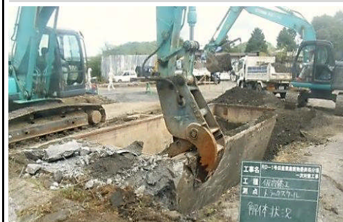
圧碎機(通称:ニブラ) 通常はこちらを使用します。