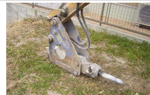
破砕機(通称:アイオン) 一部の構造物に使用します。