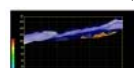
熱源解析例(有機物位置断面48)