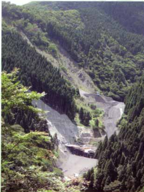
崩壊地を復旧し緑の回復に努めています (大津市葛川坊村町南谷)

管内には比良山系を中心に多くの断層が存在し、土砂崩れが起きやすい地形があります。このため森林の持つ多面的機能を高度に発揮させ、土砂の流出や崩壊を防止するために治山事業を行っています。