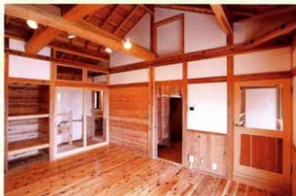
「大津の森の木で家を建てようプロジェクト」で建てられた住宅

「住まい手よし」「つくり手よし」「環境よし」の三方よしをキーワードに、森林所有者から製材所、設計士、大工、住まい手まで、全ての人が一緒に安心安全の家づくりを行っています。