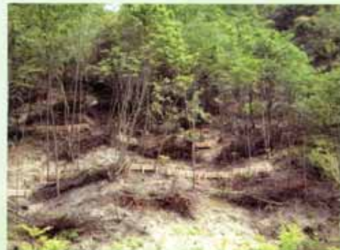
森林整備を行い、植生を回復させる ことで土砂の流出を防止します (野洲市大篠原)