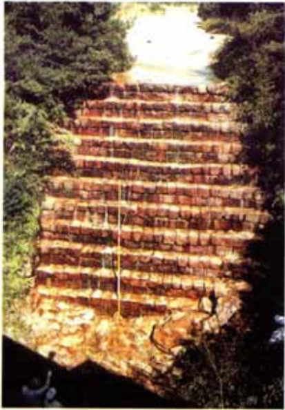
鑓 よ ダム (大津市上田上森町)