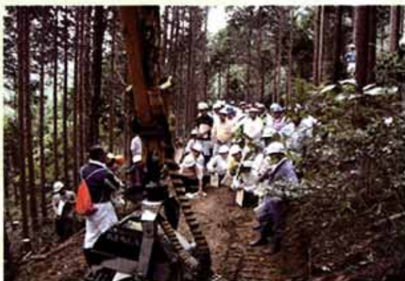
間伐材搬出の研修会（大津市）

森林所有者や森林組合への技術指導や普及啓発活動を通して森林管理のサポートを行っています。また、森林環境学習を行うことで、森林への理解と関心を深める活動を行っています。