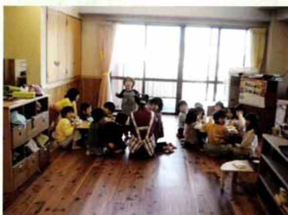
木のぬくもりのなかで過ごす園児（大津市）