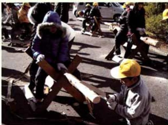
丸太切り体験の様子 森の未来館（栗東市）