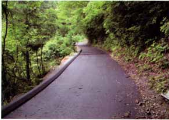
木材搬出に不可欠な林道 (林道花折線 大津市伊香立途中町)

大津・湖南地域には 74 路線の林道があり、総延長は 128km です。林道は森林の整備や木材の搬出といった林業に不可欠な役割を担っているほか、レクリエーションや生活道路としての役割も果たしています。今後は、搬出間伐による森林整備を進めるため、木材を運び出すための作業路の整備を優先的に進めていきます。