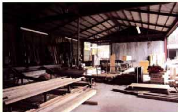
ナンシン木材センター（大津市）