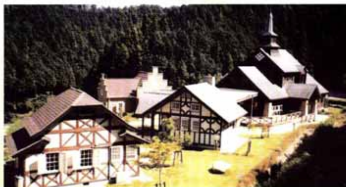
こんぜの里バンガロー村（栗東市）