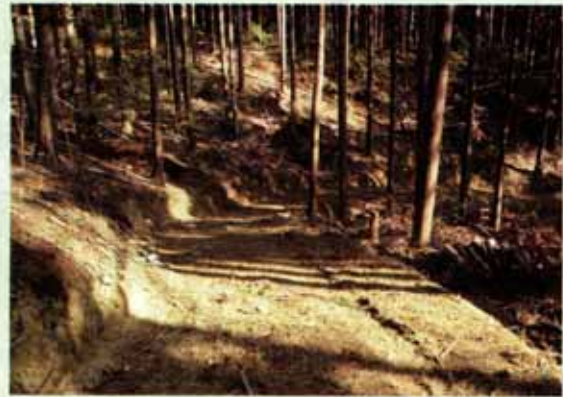
間伐材搬出に使われる作業路 (大津市仰木町)

管内には比良山系を中心に多くの断層が存在し、土砂崩れが起きやすい地形があります。このため森林の持つ多面的機能を高度に発揮させ、土砂の流出や崩壊を防止するために治山事業を行っています。