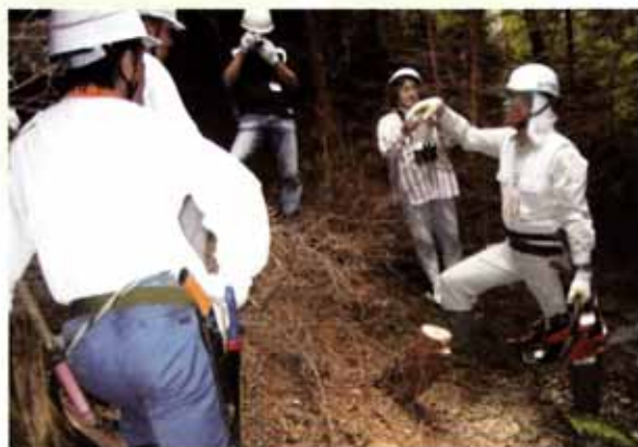
森林所有者への間伐技術指導