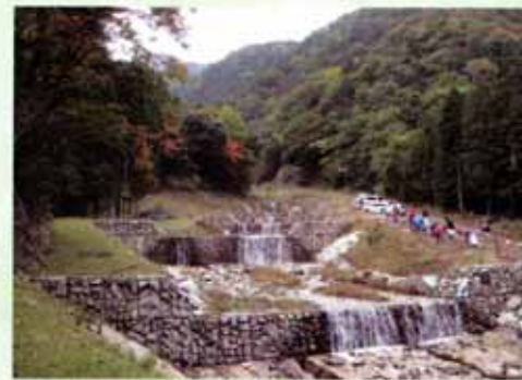
治山ダムで溪流の浸食を防止します (大津市南比良・大物)