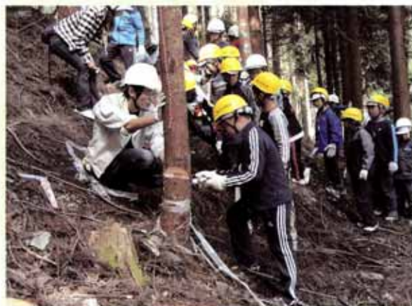
間伐体験の様子 葛川少年自然の家（大津市）