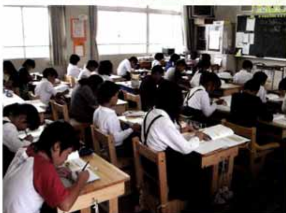
温みのある木の学習机で勉強する小学生（野洲市）