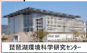
琵琶湖環境科学センター