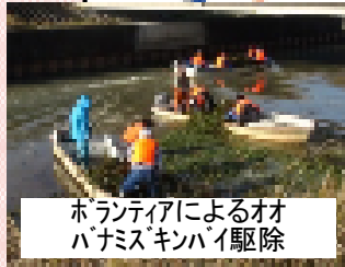
ボランティアによるオオバナミズキンバイ駆除