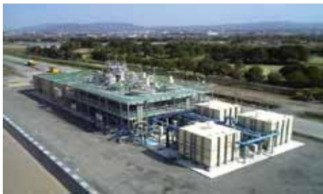
超高度処理実証施設（湖南中部浄化センター） 6,500m 3 /A

実証調査開始から約10年が経過するため、蓄積した知見の総括的などりまとめを今年度を実施し、今後の事業計画検討や運転管理等へ役立てていきます。