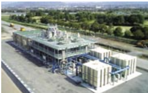
超高度処理実証施設（湖南中部浄化センター） 6,500m 3 /日

平成21年度は、生物活性炭の寿命について継続調査するとともに、微量有機化学物質等の評価について、他の研究機関の協力を得ながら検討しています。