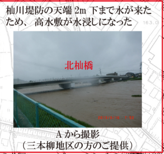
Aから撮影