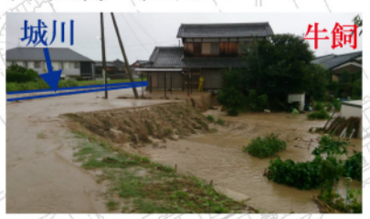
Bから撮影