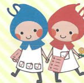
滋賀の健康を考える双子の妖精 愛称「しがのハグ&クミ」