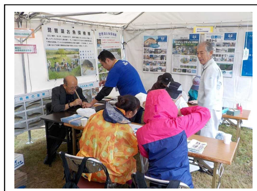
壁面：活動紹介のパネル展示