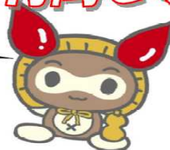
献血キャラクター けんけつちゃん

詳しくは、滋賀県赤十字血液センターへ http://www.shiga.bc.jrc.or.jp