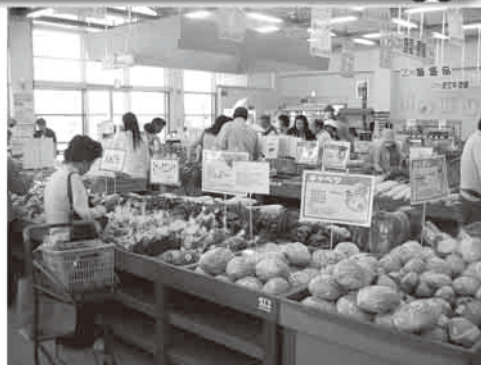
直売所にならぶ地元の野菜

当課でも、新たに野菜栽培に取り組む農業者等を支援しています。まずは直売所向けに、野菜栽培を始めてみませんか。