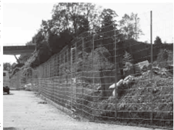
ワイヤーメッシュ柵