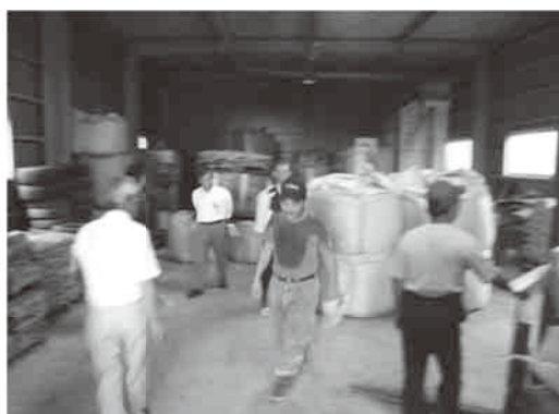
養鶏農家の倉庫に搬入された飼料用米

その結果、直播栽培は省力化と予想以上の収量が得られました。低コスト施肥の結果は下表のとおりで、収量の確保が可能であることが確認されました。また、乾燥コストの低減は、立毛乾燥で水分20%程度まで下げ、乾燥機で適正水分15%に仕上げることでコストを下げる事ができました。