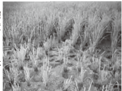
シカに食べられた稲

鳥獣害の中で、近年特に困っているのがシカによる農作物被害です。県内のシカの推定生息数は平成19年度26,300頭で、近年増加傾向にある農林業被害もあって、県では特定鳥獣保護管理計画(ニホンシカ)を変更して、年間捕獲目標頭数の増加や狩猟期間の延長などで、個体数を減らすこととしました。