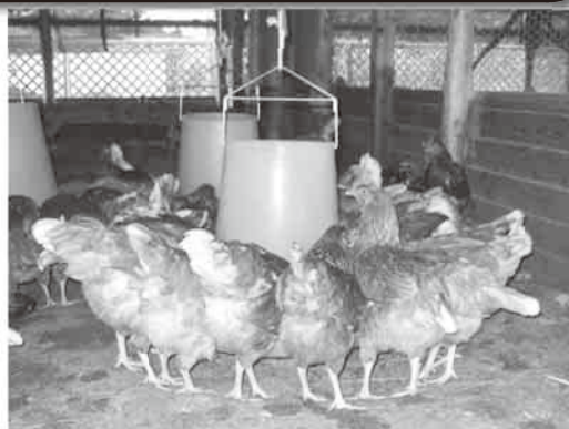
えさを食べる採卵鶏

県では、飼料自給率の向上だけでなく、温室効果ガスの削減のためにも、耕種（稲作）農家と契約して飼料用米を使う畜産農家を対象として、「飼料用米普及拡大事業」を実施しています。