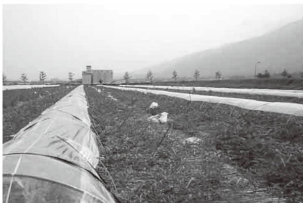
比良すいか（大津市）