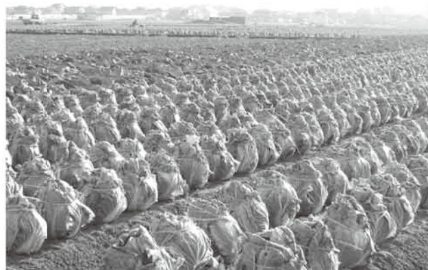
冬穫りはくさい（守山市）