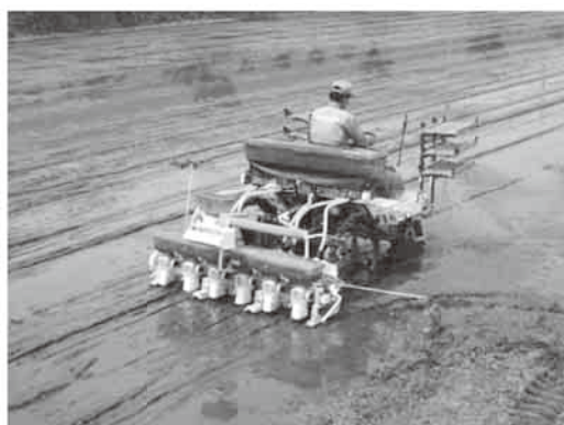
直播で飼料用米の低コスト生産に挑戦