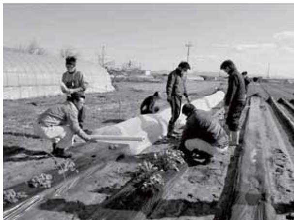
青年部による親株の移植作業

野洲市の吉川野菜生産出荷組合は、高齢化が進み、組合設立（昭和55年）時より組合員が3分の1程度まで減少していますが、組合員の後継者を主体に30～40代の若手農業者が10名程度おられます。同組合では、将来の組合を担う人材の育成と組合の活性化に向けて、平成28年1月に青年部が設立されました。