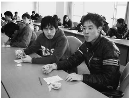
大学生との意見交換会

「アスリート饅頭」は、北比良産のもち米、うるち米、野菜、大豆を多く使った炊き込みおこわを小麦粉の皮で包んだ蒸し饅頭で、炭水化物、たんぱく質、脂質のバランスやカロリー等を考慮した商品に仕上がりました。