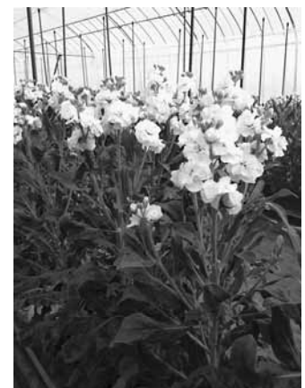
スプレーストック