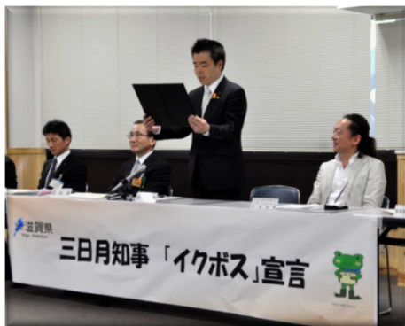
三日月知事によるイクボス宣言 平成 27 年 4 月 30 日、県庁にて

平成 27 年 6 月 16 日、笠間警察本部長、警察署長、本部所属長 62 名が宣言