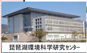
琵琶湖環境科学センター