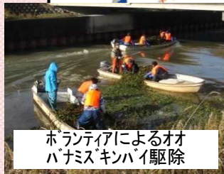
ボランティアによるオオバナミズキンバイ駆除