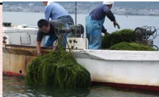
水草刈取(根こそぎ除去)