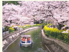
春の試行事業(安朱橋付近)

明治期の先人たちが築き上げた貴重な産業遺産である琵琶湖疏水。旅客・貨物とも大いに利用された舟運（通船）は、交通網の発達に伴い昭和26年にその姿を消しました。平成27年には、64年ぶりの復活となる試行事業を実現。現在、新たな観光船の建造等、事業の本格化を目指しています。