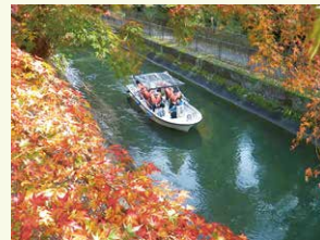
秋の試行事業(本園寺付近)