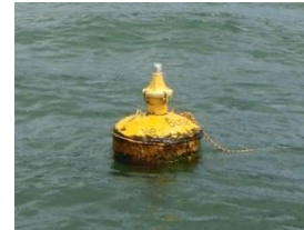
No.なし(ポール折れ) H29.8.12.南浜沖