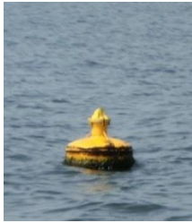
11-1(ポール折れ) H29.7.8.松原沖