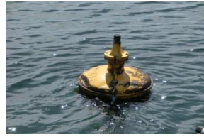
8-1(ポール折れ) H29.9.10.横江浜沖