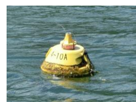
4-10A(ポール折れ) H29.9.2.八屋戸浜沖