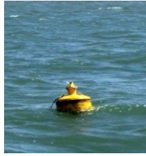
11-1(ポール折れ) H29.8.12.松原沖