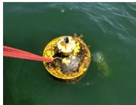
5-7(ポール折れ) H29.6.4.中浜沖