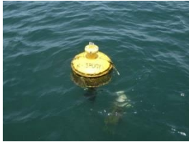
5-3(ポール折れ) H29.6.24.須越沖