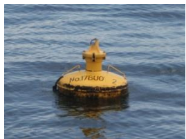
17-2(ポール折れ) H29.8.19.南浜沖