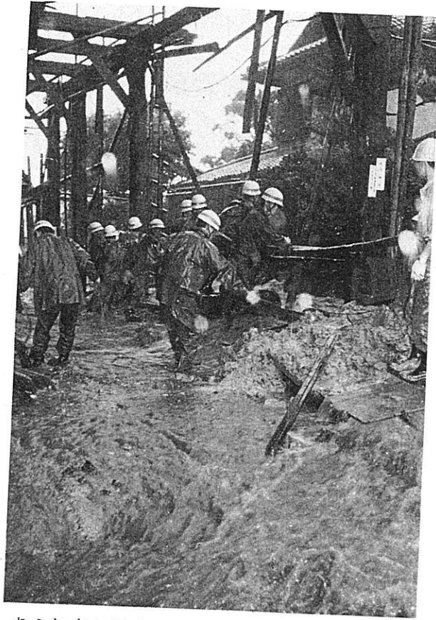
あふれ出た吾妻川をせきとめた建設資材の取り除きにあたる人たち（大津市）