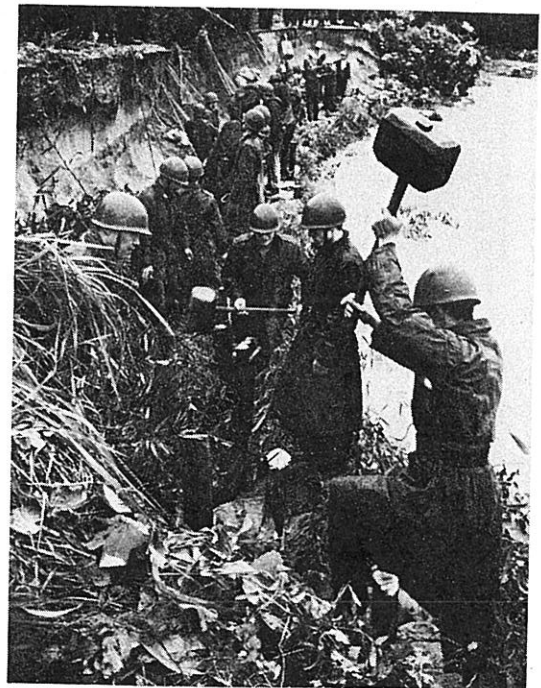
復旧作業に取りくむ自衛隊員(安曇川町)