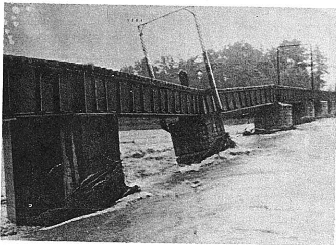
無残に傾いた近江鉄道野洲川鉄橋の橋脚(水口町)