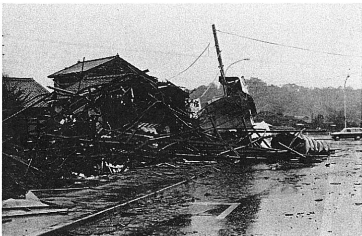
◀ 通路の向い側から吹きとんできた 鉄骨で倒壊した家 (彦根市)