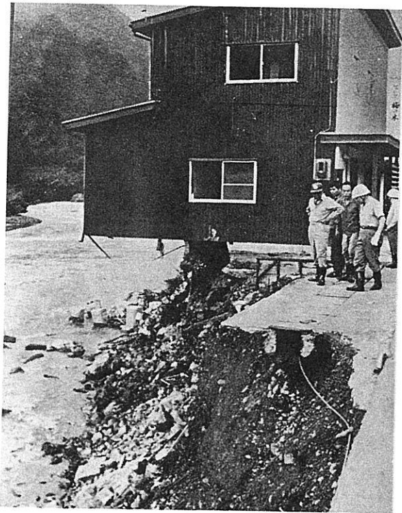
西田大津市長現地視察(大津・葛川)