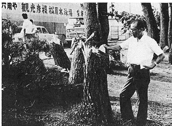
◀ 突風のため引き裂かれた松並木 (彦根市松原水泳場)