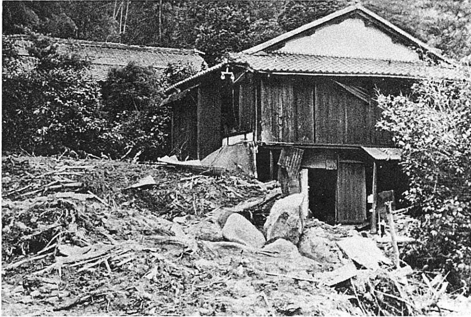
土砂が流入して半壊した住宅（近江八幡市）