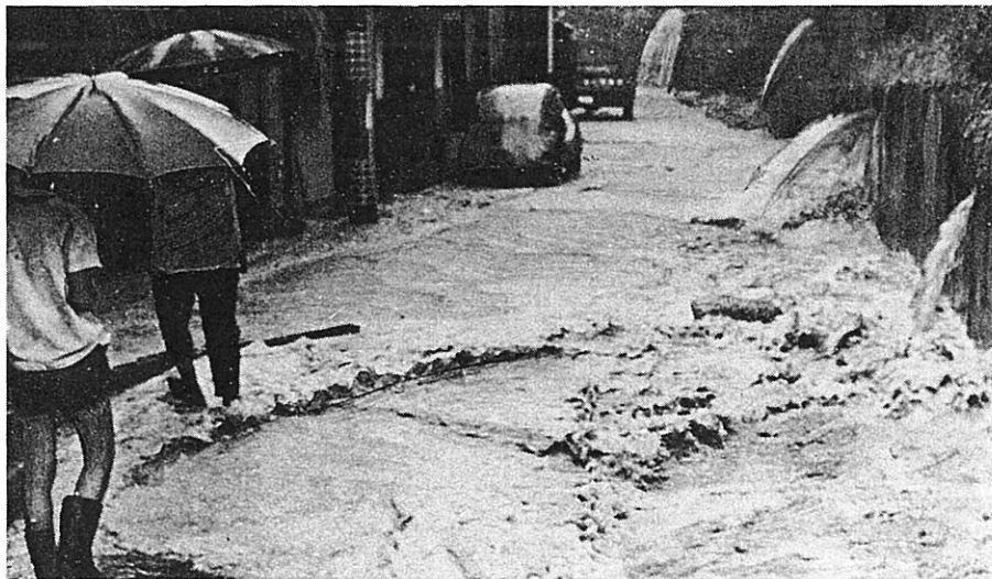
市道にまであふれた泥水（大津市）