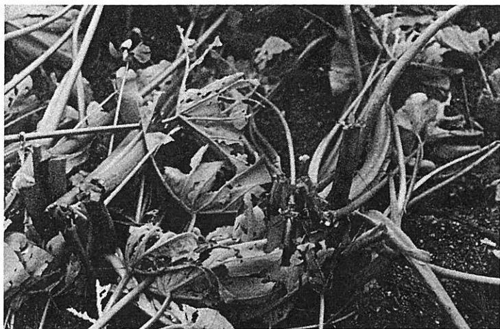
◀ 降ひょうで被害を受けた里いも畑 (彦根市)