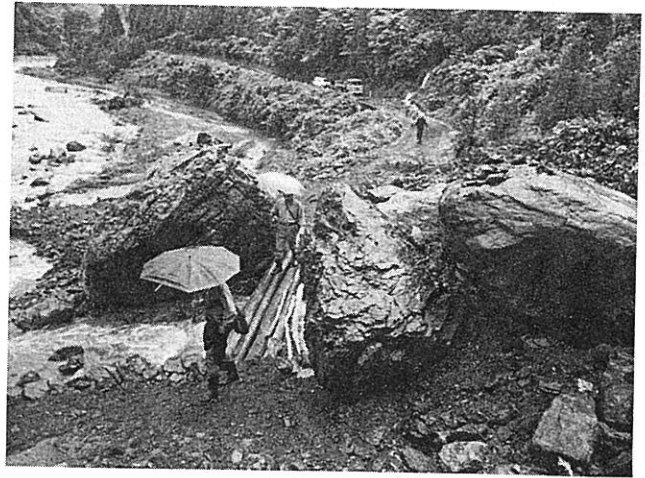
転落した巨岩のため通行不能となった県道、 左側は安曇川(大津市葛川)