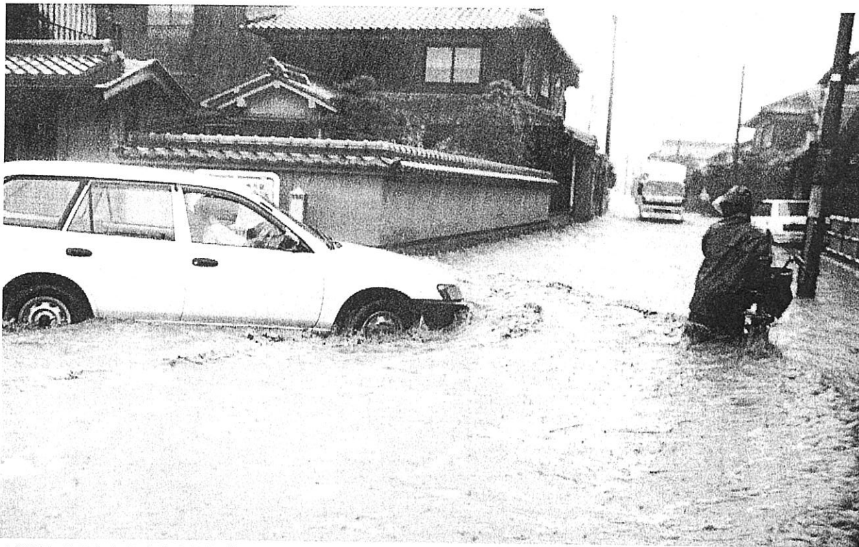
▲濁流にあらわれる大津市街地