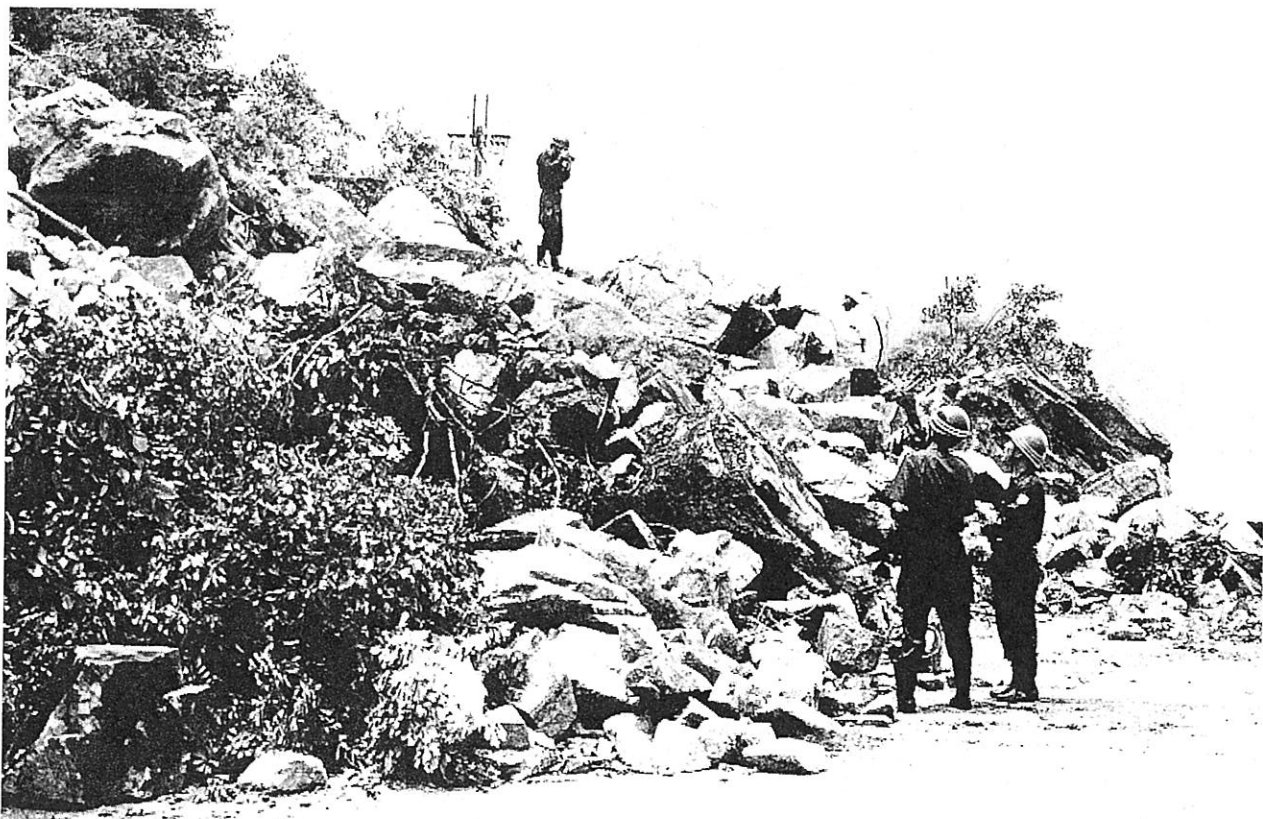
▲始まった現場検証 (近江八幡市)