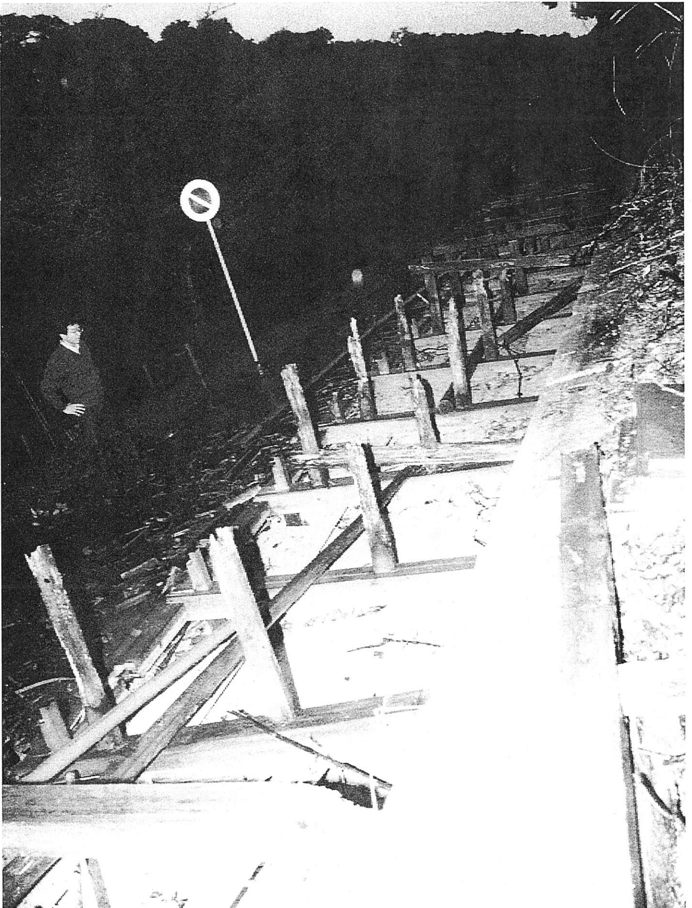
▲約130mに渡って倒れた玄宮園の土塀 (彦根市)