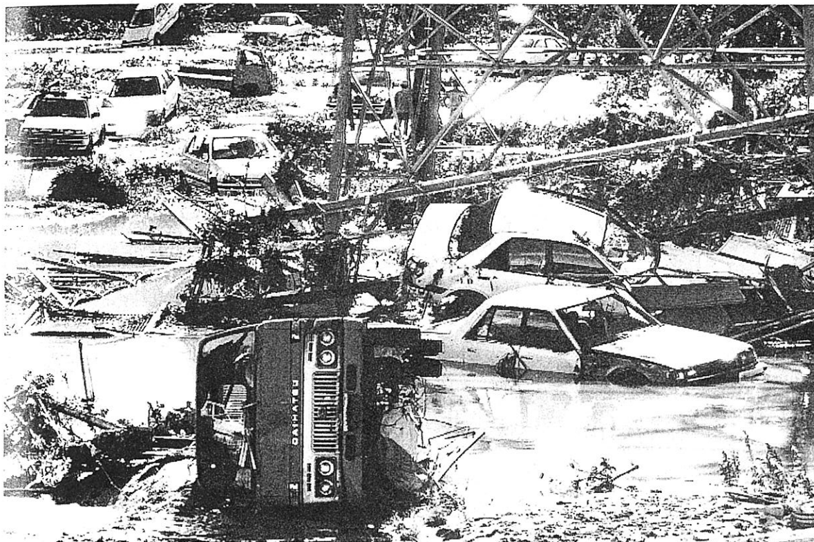
▲愛知川決壊で泥の海に埋まった乗用車など (能登川町)