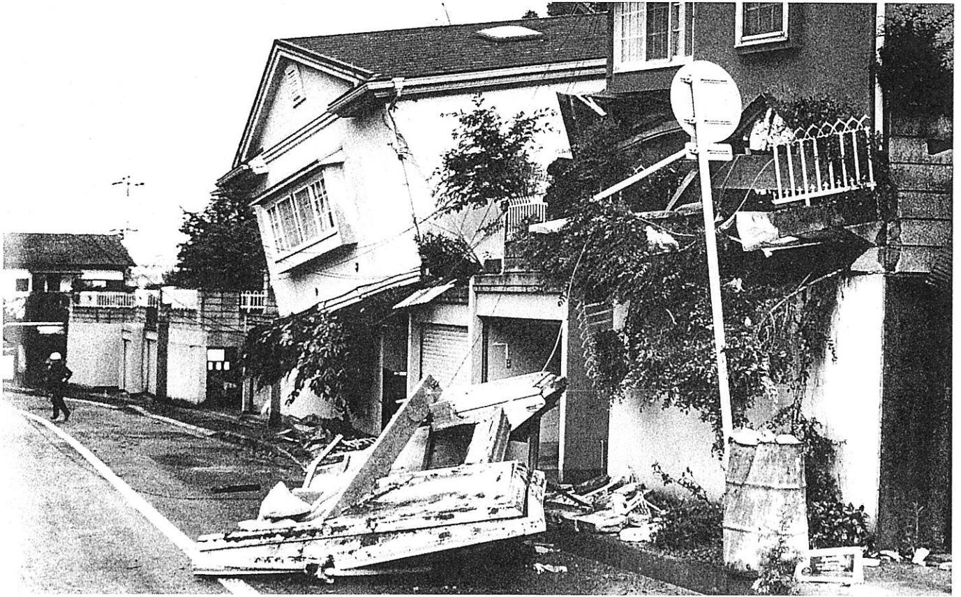
▲裏山の土砂くずれで大きく傾いた民家 (大津市)