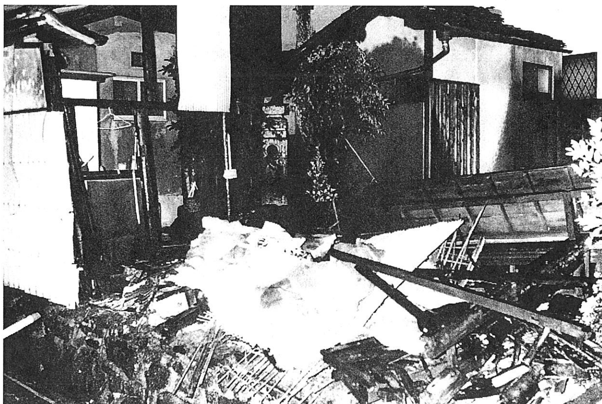
▲台風の影響で土塀が道路へ倒壊 (大津市)