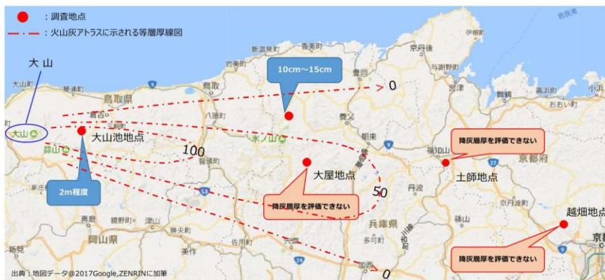
火山灰アトラスに示されるDNP 等層厚線図