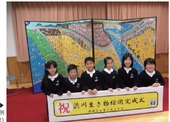
写真10-2-2 ▶ 地域を教材として活用した事例 「滋川生き物絵図」（草津市立滋川小学校）