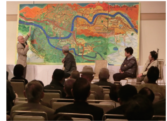
写真10-2-1 地域を教材として活用した事例 「山内ふるさと絵屏風黒川」（山内エコクラブ）

琵琶湖に代表される豊かな自然と、その自然を人々が守り育んできた歴史を有する滋賀は、環境について学ぶための生きた教材の宝庫です。身近な自然や環境を学習教材として活用することで、その学びを地域づくりや地域の抱える課題解決へと生かしていくことができることに加え、環境学習を通じて自分たちの地域を知ることは、郷土への誇りや愛着心を育てることにもつながります。