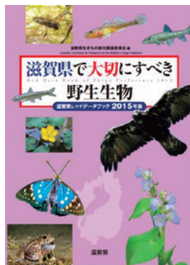
写真 7-3-1 「滋賀県レッドデータブック2015年版」

国が最初のレッドデータブックを1989年に刊行し改訂を重ねるなか、滋賀県でも県版レッドデータブックを2000年度から5年ごとに出版しています。ともに版を重ねるにつれ、掲載種数が増えるとともに現状評価が深刻化する種が多く、滋賀県でも野生生物が危機的な状況にあることを物語っています。