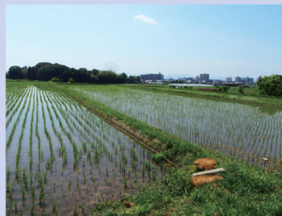
写真 T-1 真野町の水田 多様なイタチムシ類が生息している

イタチムシもそんなリスト漏れ生物のひとつです。水田ではほぼ見られないと言われていましたが、なんと湖西の水田から40種以上が一度に見つかりました。ボーリングピンに二本の尻尾が生えたような見た目、古い論文でも「かわいらしい小虫」と表現されるわずか100μmほどの微小生物です（福井,1930）。