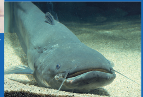
ビワコオオナマス