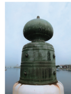
写真3-4-3 瀬田橋の擬宝珠