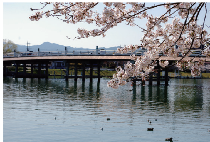
写真3-4-4 瀬田の唐橋(現在)