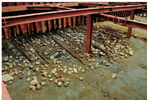
写真3-4-1 古代瀬田橋の基礎

瀬田川に架かる瀬田橋(唐橋)は、山崎橋・宇治橋とならび日本三古橋の一つに挙げられます。これらの橋は、いずれも都の周辺に位置し、古代から架けられており、維持管理には国家が直接関与するという方法がとられていました。この頃の橋脚は瀬田川の底から発掘されており、具体的な姿を想像することができます。