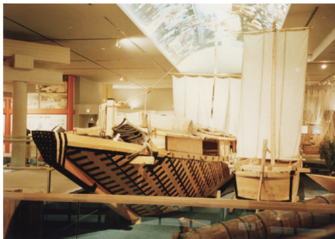
写真3-3-1 琵琶湖博物館の丸子船（左）と漁船（ハリブネ）

と深く結びついたものであり、そこでは百石積み程度の丸子船から田舟までの小型の木造船が、生活の足として、また農業のみならず鉱・工業などにも、重量物・大型物の輸送面で貢献していました。丸子船のような運搬船は、帆を用いた方が安定し、しかも荷がたくさん積めたといえます。こういったエンジンなしで用が足りる規模での船の機能が、近代以降の琵琶湖周辺地域における湖上交通では求められていたのです。