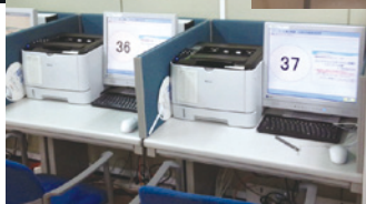
▲求人情報検索端末