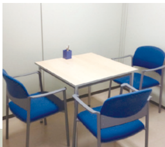
▲カウンセリングルーム