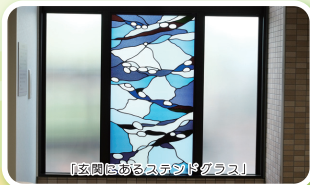
「玄関にあるステンドグラス」