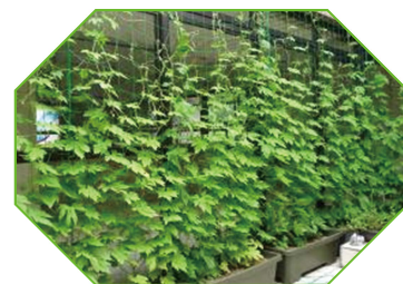
昨年のグリーンカーテン

患者さんとともに、これから朝夕の水やり、ツルの誘引や追肥などの手入れを行いながら、植物の成長を見る喜び、涼やかな気分、節電効果、そして実り！を体感できるのを楽しみにしています。