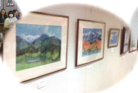
写真2 作品展(大津市民会館にて)