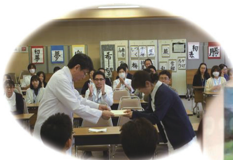
写真1 表彰式の様子