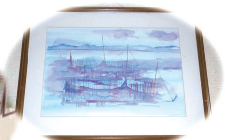
写真3 当センター外来ロビー掲示