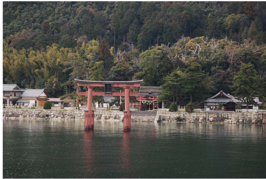
【うやまう】 上 湖中に立つ鳥居（白髭神社）