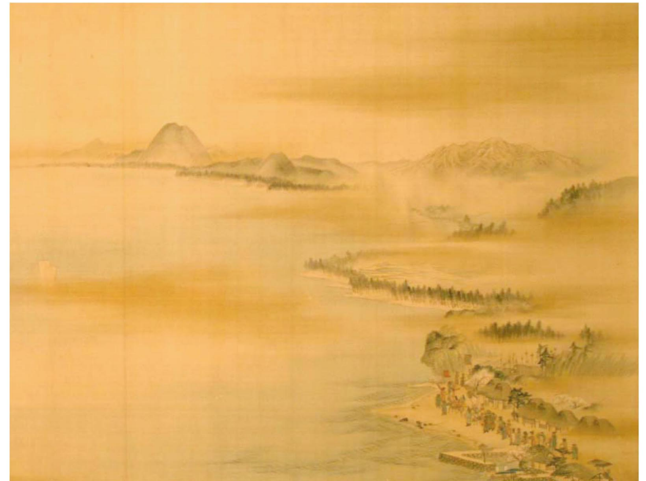
『琵琶湖図』 円山応震筆 滋賀県立琵琶文化館所蔵

私たちの暮らす滋賀県は「近江（淡海）」の名前が示すように、琵琶湖に生まれ、琵琶湖と共に歩んできた。