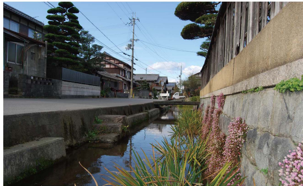
【くらす】 下 水路がめぐる村（伊庭）