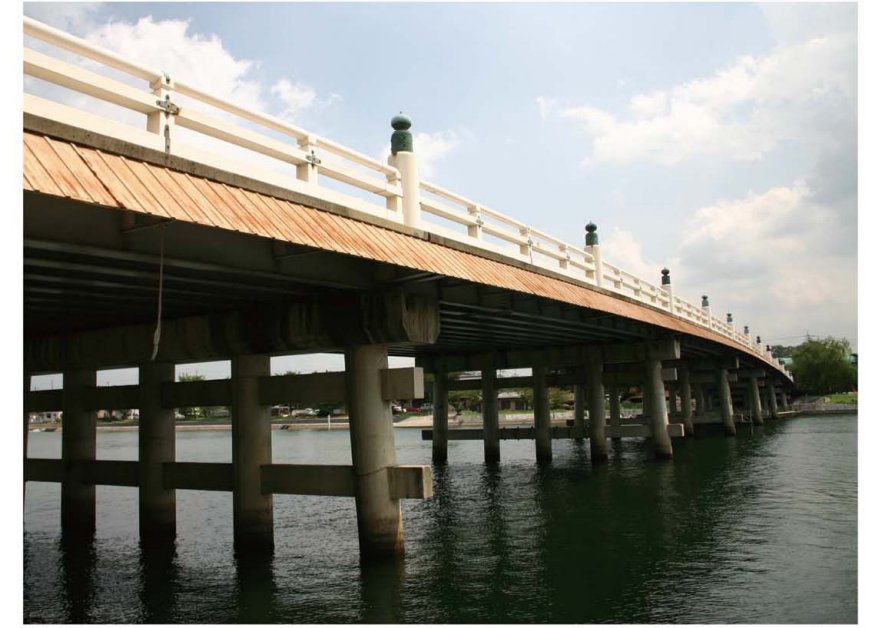
【めでの】 下右 滋賀県の花（鎌掛谷のシャクナゲ）