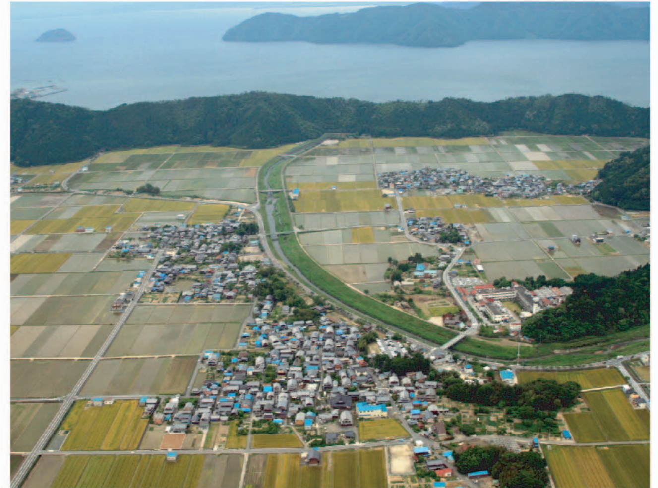
東上空から見た西野水道および余呉川西野放水路

塩津湾の東岸は、琵琶湖と伊香郡の平野部とのあいだを古保利丘陵がさえぎり、その丘陵東麓ではしばしば余呉川が氾濫した。西野水道はこの川水を琵琶湖に排水するための洞門(水道)で、江戸時代の末期に洪水の被災地である西野村の人々が幾多の苦難を乗り越えて掘り貫きに成功した。菊池寛の小説『恩讐の彼方に』で有名な「青の洞門」(大分県中津市本耶馬溪町)に対比して「近江の青の洞門」とも呼ばれる。