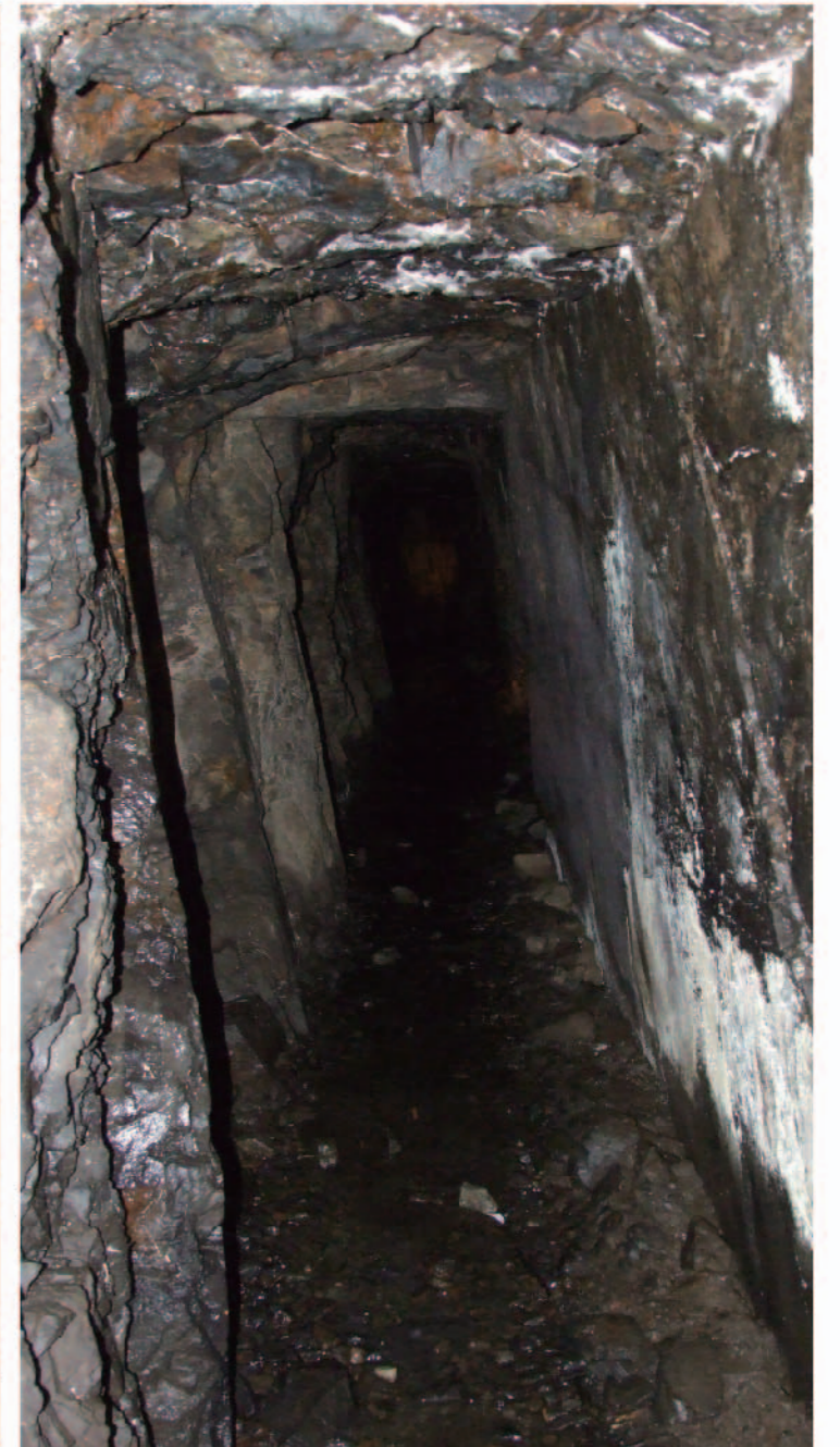
西野水道(洞門内部)