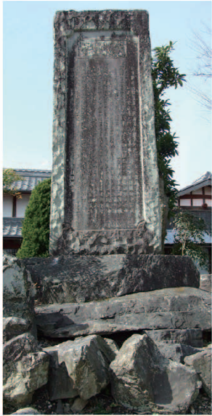
西野水道顕彰碑「水閘實記」