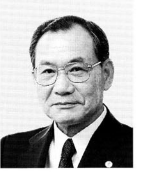
最高裁判所判事 白木 勇 昭和二十年二月二十五日生