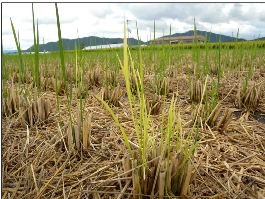
図1. イネ縞葉枯病が発生した刈株再生芽

本病の蔓延を防止するため、刈株再生芽でイネ縞葉枯病の発生が目立つ場・地域では、刈株を放置せずに速やかに水田を耕起するとともに、次作ではヒメトビウンカに効果のある育苗箱施用剤による防除を実施しましょう。